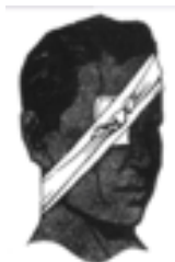
ПАТЧ ДЛЯ ОЧЕЙ