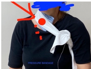
ТИСК НА ШИЮ, ПОВ'ЯЗКА