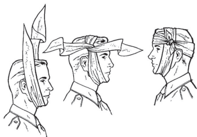
Перелом щелепної кістки