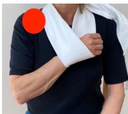
КОМІР ТА МАНЖЕТ