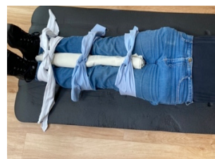
ШИНА ДЛЯ НІГ